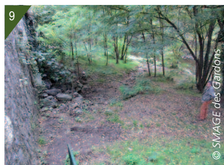
8- 9- Secteur colonisé par la Renouée du Japon à la Grand'Combe en 2009 et en 2013.