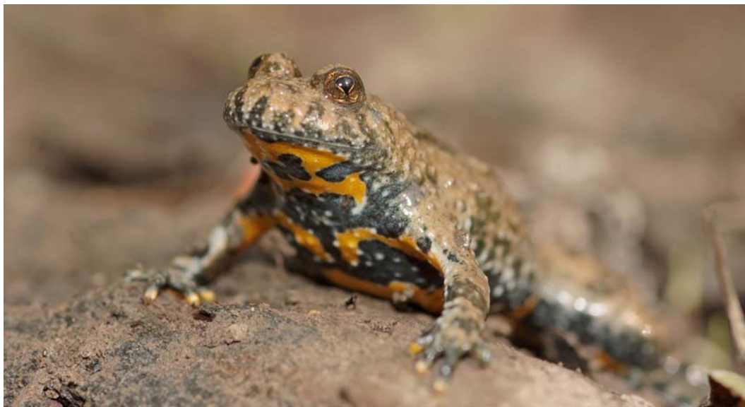
Mâle adulte de Sonneur à ventre jaune. Forêt de Mackenheim, avril 2011

actions, qui sont réparties en trois grandes thématiques : « Connaissance », « Conservation » et « Réseaux et communication ».