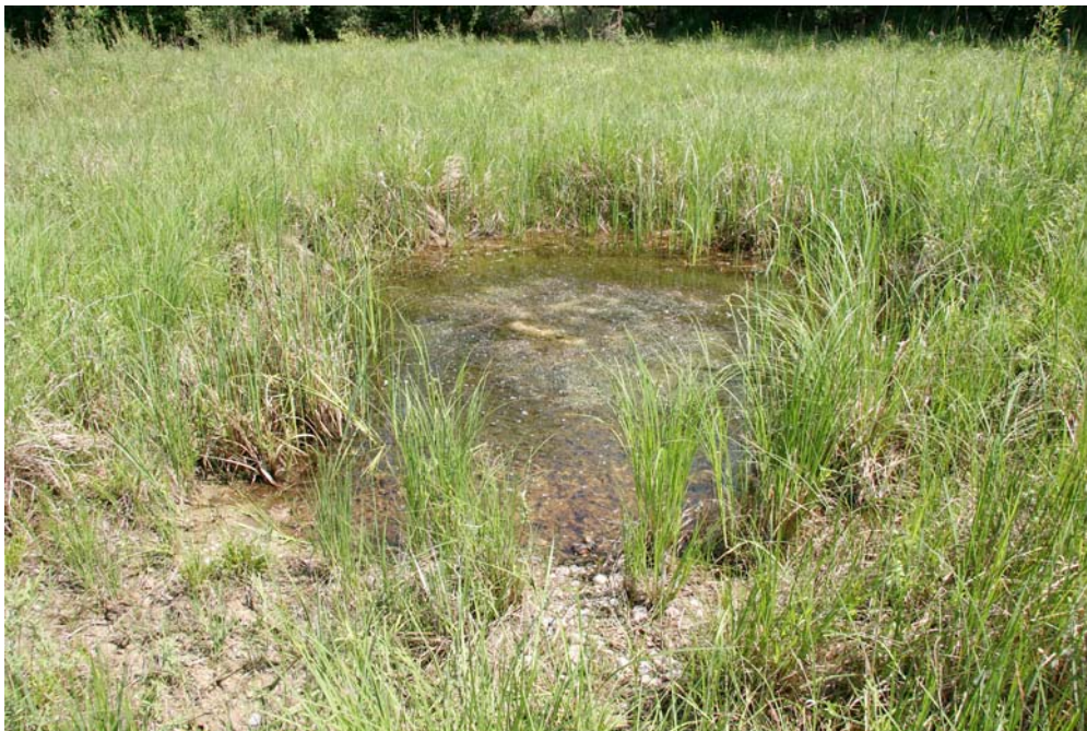
Une mare favorable au Sonneur à ventre jaune dans la RNN de l'île de Rhinau, mai 2009.