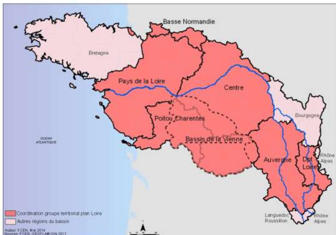
Figure Erreur ! Pas de séquence spécifié. : emprise géographique du groupe de travail de bassin (Geographic limits of the territorial coordination in the basin)

Des coordinations d'échange et d'animation dans les régions, départements et sous-bassins ont été développées dans le bassin de la Loire et en Bretagne. Portés par des acteurs du territoire concerné, ces groupes comprennent des structures de gestion des milieux naturels (Conservatoire d'espaces naturels Centre-Val de Loire, Auvergne, Pays de la Loire et Basse-Normandie), des associations (Centre Permanent d'Initiatives pour l'Environnement) et des scientifiques et experts qui viennent en appui des travaux à ces échelles (Conservatoires botaniques nationaux, INRA, IRSTEA, Universités de Tours et d'Angers), des collectivités (Etablissements publics territoriaux de la Vienne et de la Vilaine) et des institutions du territoire (DREAL Pays de la Loire et Centre-Val de Loire, Forum des marais atlantiques, Observatoire régional Poitou-Charentes de l'Environnement).