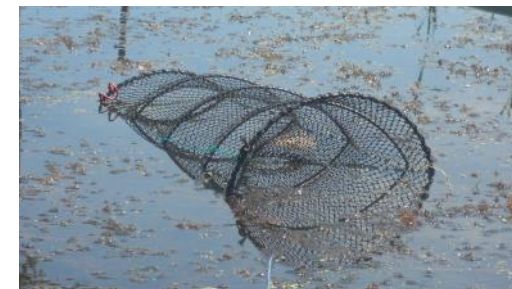
Nasse servant à la capture des Xénope adultes

Ces études se poursuivent aujourd'hui sous l'impulsion notamment de la Communauté d'Agglomération du Bocage Bressuirais.