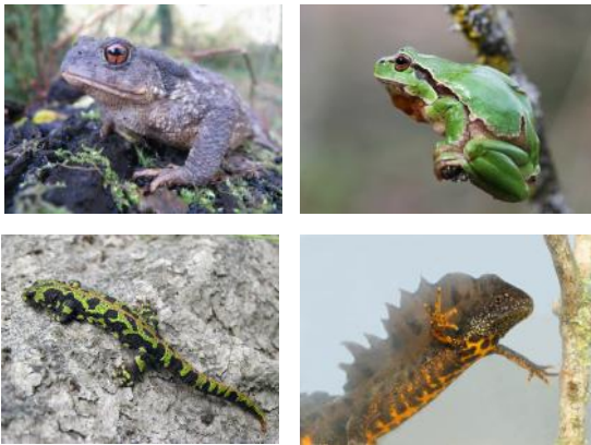
De gauche à droite et de haut en bas : Crapaud épineux, Rainette verte, Triton marbré, Triton crêté ; 4 espèces typiques de nos mares

La destruction et la dégradation de leurs habitats en sont les principales causes. L'introduction d'espèces exotiques se surajoute aux menaces qui pèsent déjà sur ces animaux fragilisés.