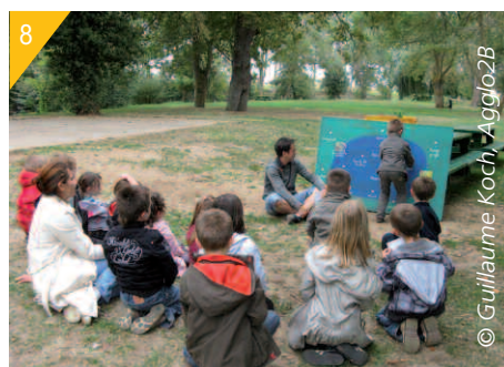
7- Captures de Xénopés.