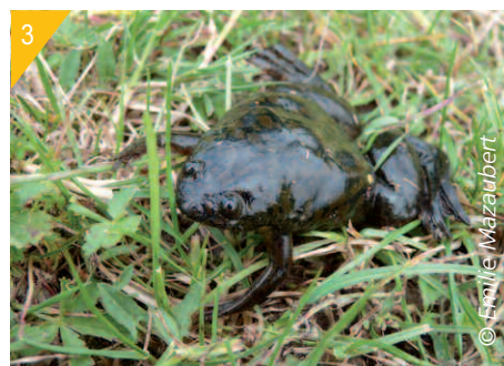
3- Xénope lisse.