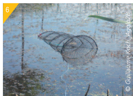
4- 5- 6- Préparation et mise en place des nasses pour le piégeage du Xénope lisse.