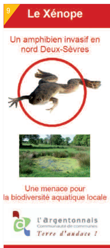
9- Plaquette sur le Xénope lisse.

Rédaction : Guillaume Koch et Benjamin Audebaud, Agglo2b, Emmanuelle Sarat, Comité français de l'UICN et Emilie Mazaubert, Irstea