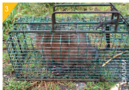
3- Capture avec une cage piège.