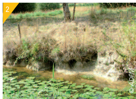
2- Terriers creusés dans une berge.