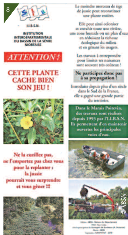
8- Plaque de sensibilisation sur la jussie.