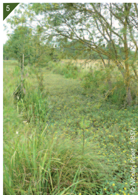
3-4- Cours d'eau colonisés par les jussies. 5- Canal colonisé par les jussies.