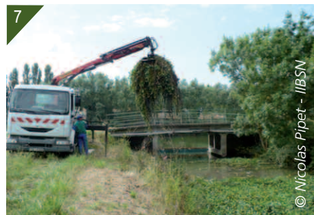
6- Arrachage manuel. 7- Arrachage mécanique.