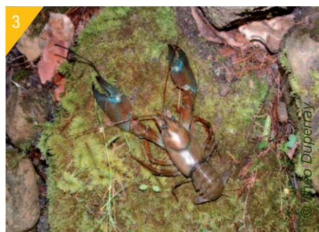
3- Écrevisse de Californie ( Pacifastacus leniusculus ).