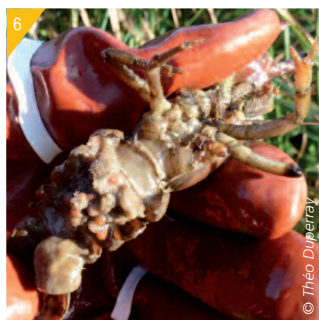
5- Ponte viable (œufs marron).