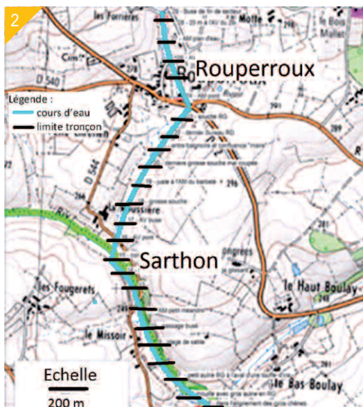
1- Localisation du site d'intervention.