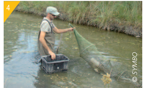
3- Relevé d'une cage-piège « cage Fesquet ». 4- Relevé d'un verveux.