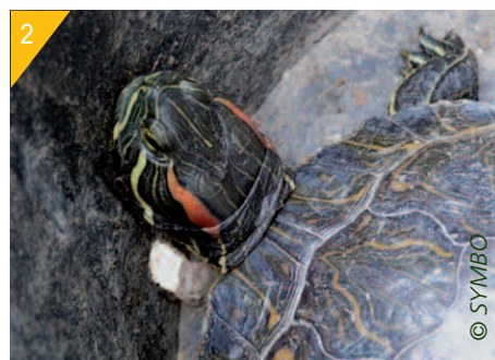
2- Trachémyde à tempes rouges ( Trachemys scripta elegans ).