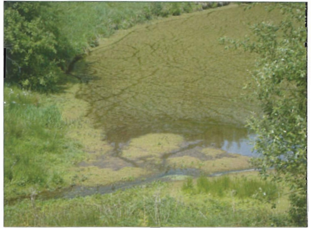
Photo 2 : Crassula helmsii au château de Chaulieu. Photo : T. Hébert, mai 2011.