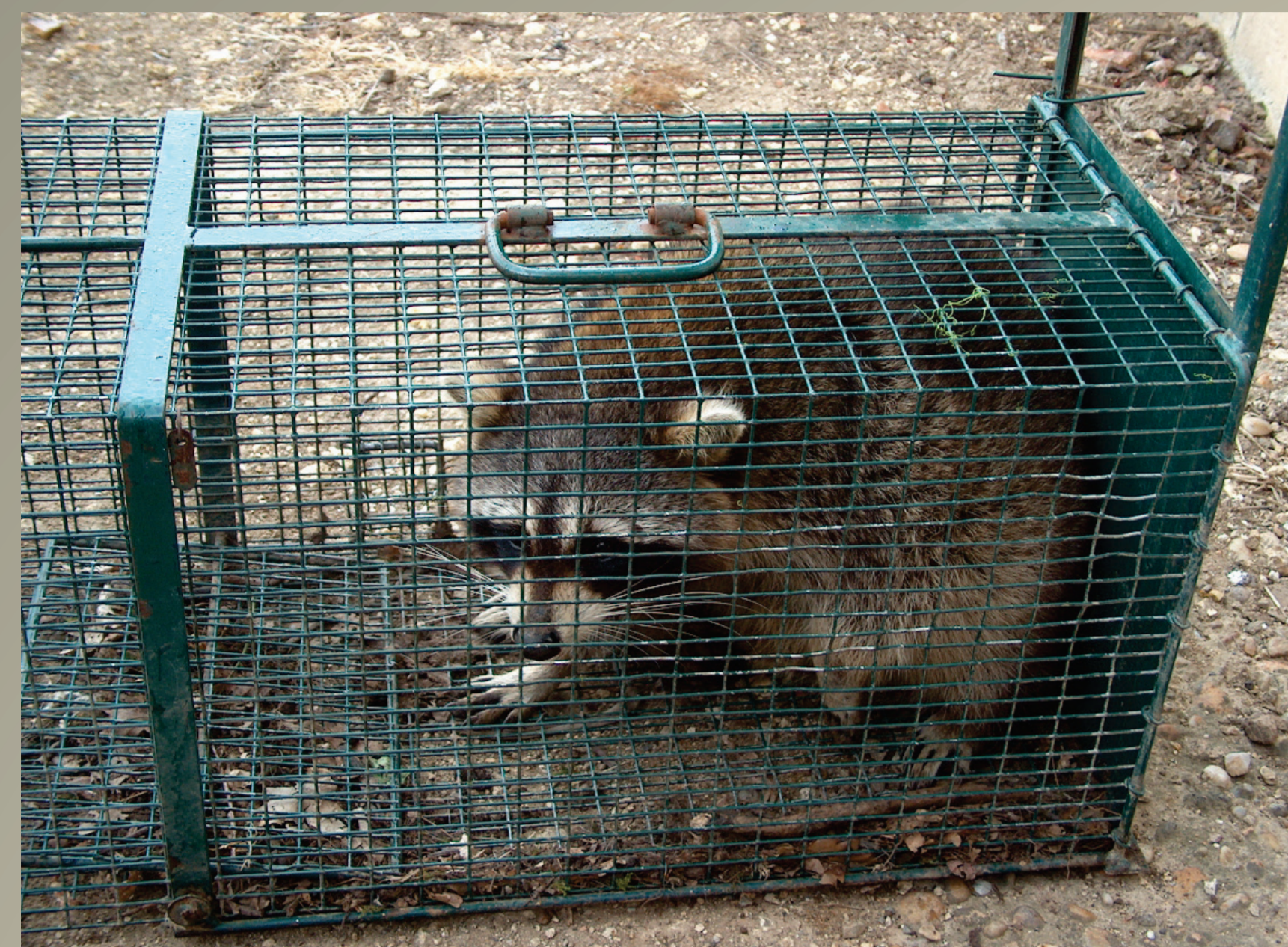
Raton laveur capturé dans une cage-piège (C. Coïc)

Le Raton laveur, Procyon lotor , est un Mammifère Carnivore appartenant à la famille des Procyonidés. Son aire de répartition d'origine couvre une large superficie du continent nord américain. L'espèce a été introduite et s'est naturalisée à des époques différentes dans de nombreux milieux insulaires mais également en milieu continental en Europe et en Asie. En France, les deux noyaux de populations actuels se situent dans l'Aisne (ce noyau connaît une expansion notable depuis les années 1990) ainsi qu'en Alsace, en Lorraine et dans les Vosges, suite à l'extension de la population allemande. En dehors de ces deux noyaux des observations et des captures occasionnelles ont été signalées dans plus de dix départements depuis les années 1960.